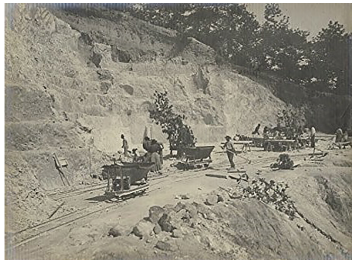
Gradoni con binari Decauville (1920)